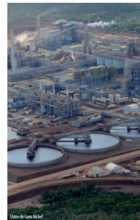
Usine de Goro Nickel

Plusieurs quartiers possèdent ensuite un bâti moins dense et déconnecté du tissu urbain nouméen, constituant les zones périurbaines ou de rurbanisation de l'agglomération.