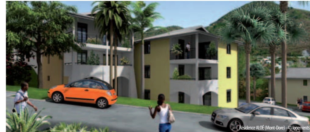
Résidence ALOÉ (Mont-Dore) - 41 logements

Nom : Aloé Résidence principale et locative Nbre de lots : 31 Nbre de parkings : 40 Ouverture de chantier : 4 e trimestre 2012 Achèvement : 2 e trimestre 2014