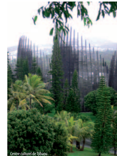
Centre culturel de Tjibaou

Le Grand Nouméa n'est donc rien d'autre que le bassin de vie de ceux qui y habitent ; c'est dans ce cadre spatial qu'ils résident, travaillent, se cultivent, se distraient, se déplacent donc aussi, en un mot qu'ils vivent ! Ce Grand Nouméa, agglomération urbaine en constitution, est la « turbine » économique de la Nouvelle-Calédonie comptant, à elle seule, pour 75 % du PIB total. L'agglomération est aussi la « turbine » sociale de