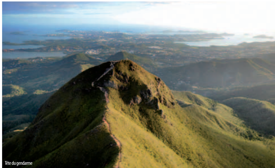
Tête du gendarme

“Yahoué permet à ses habitants de bénéficier de toutes les infrastructures d'une agglomération”