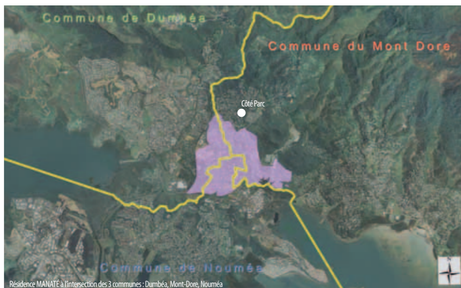
Résidence MANATÉ à l'intersection des 3 communes : Dumbéa, Mont-Dore, Nouméa