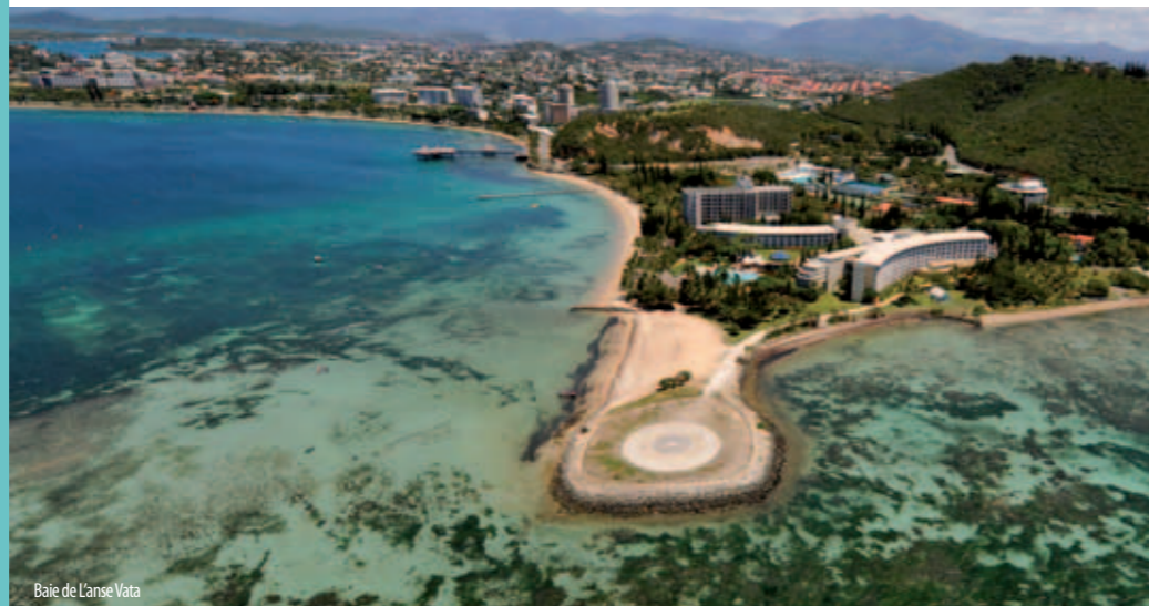
Baie de l'Anse Vata

La Nouvelle-Calédonie compte 9 établissements de crédit implantés localement, dont 4 banques et 5 sociétés financières. 7 établissements de crédit hors zone interviennent régulièrement en Nouvelle-Calédonie, dont l'Agence Française de Développement, la Caisse des Dépôts et Consignations et la Banque Européenne d'Investissement. Au cours des cinq dernières années, l'activité bancaire et financière a connu une progression rapide, comme en témoigne l'accroissement des encours de crédit (+9,6 % en 2010), dont 73 % contractés auprès des établissements locaux. Les encours portés par ces derniers sur les ménages et les entreprises progressent respectivement de 8,9 % et 5,2 % en 2010 et