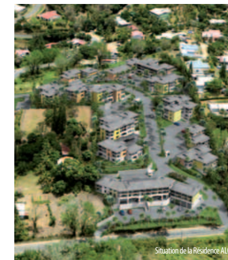
Situation de la Résidence ALOÉ

Les occupants de la résidence (propriétaires ou locataires) pourront profiter du cadre de vie privilégiée qu'offre l'écrin de verdure qui accueille l'ensemble immobilier Côté Parc.